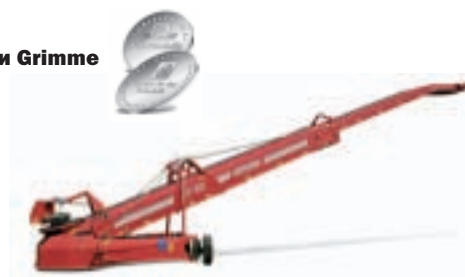
Телескопический ленточный погрузчик