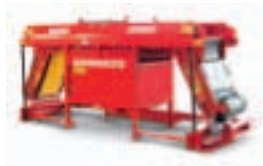
Устройство для заполнения контейнеров