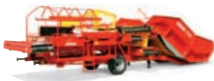
Комбинированная машина: с устройством для сортировки